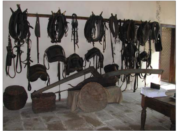
Cascina Castello, interno del Centro Etnografico