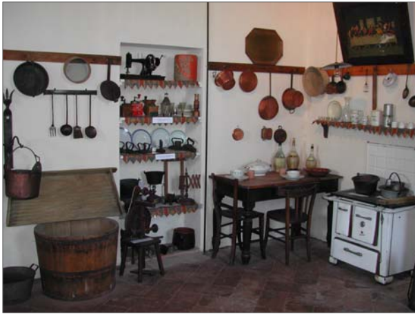
Cascina Castello, interno del Centro Etnografico