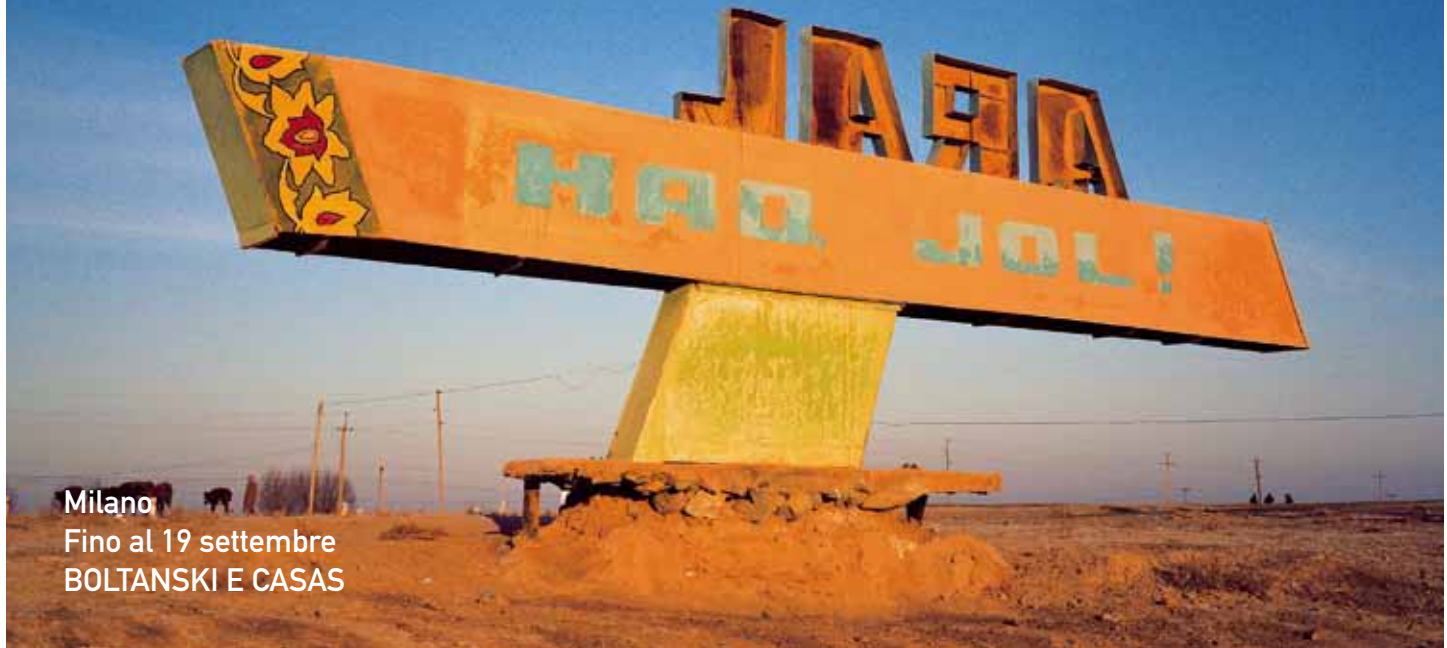
Milano Fino al 19 settembre BOLTANSKI E CASAS