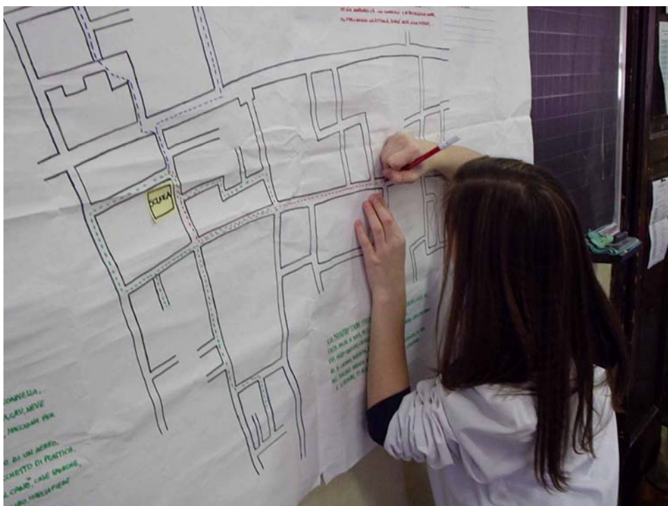
Esempi di percorsi casa-scuola fatti dai bambini