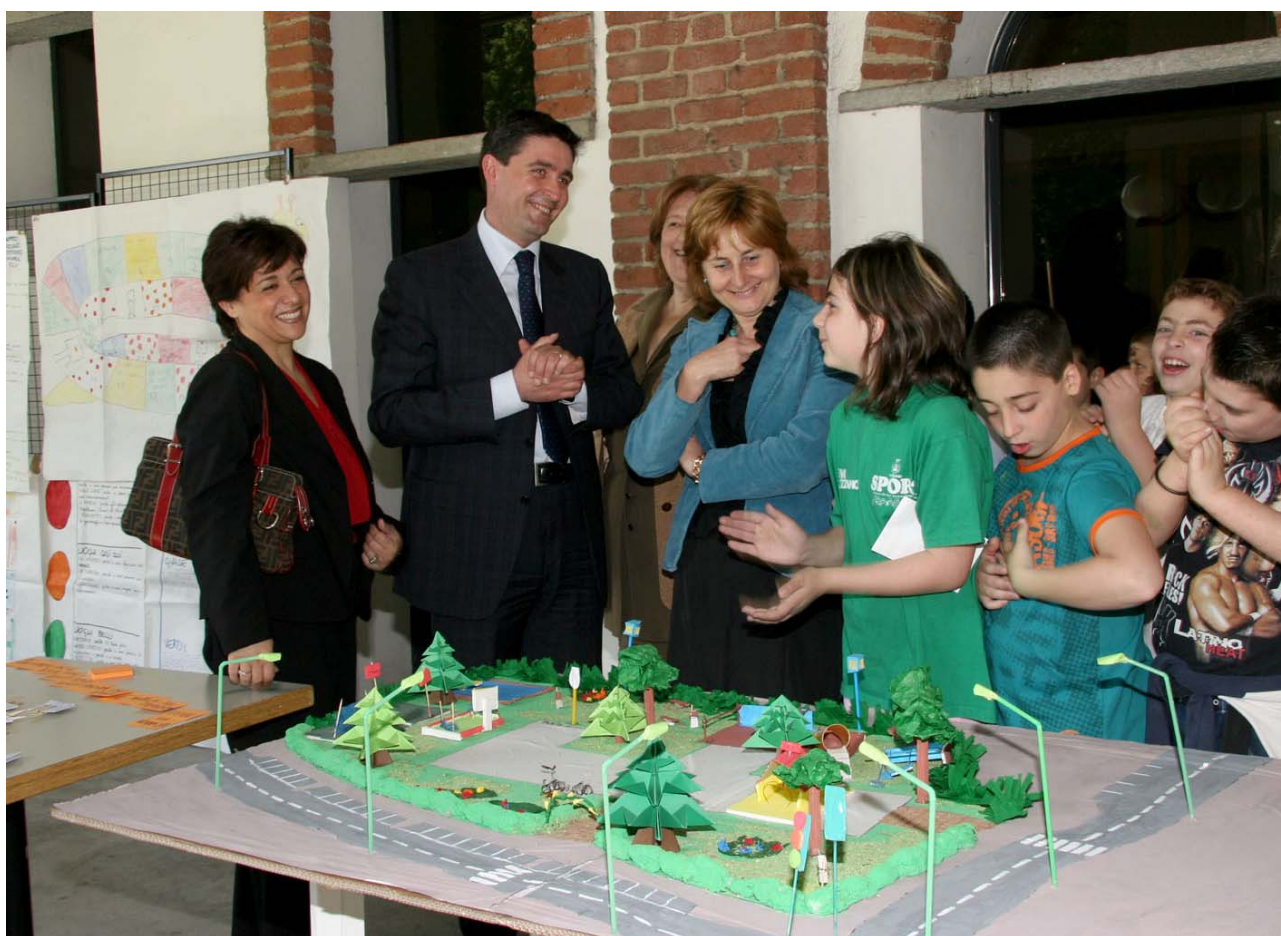
“L'assessora Bruna Brembilla ha partecipato al gioco creato dai ragazzi e dalle ragazze di Senago”

Questi lavori sono stati presentati all'Assessora all'Ambiente della Provincia di Milano Bruna Brembilla durante la festa conclusiva di Pegaso che si è tenuta al Parco di Villa Monzini a Senago il 26 maggio 2006.