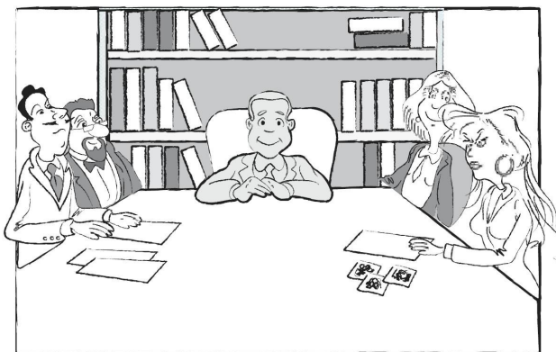
Illustrazioni: Giovanni Mapelli

L'incontro permetterà di conoscere meglio il tema della mediazione dei conflitti e cioè di alcune modalità di approccio alle controversie che tentano di andare oltre la logica del torto e della ragione dando un punto di vista differente e cercando di aiutare le persone a risolvere alcuni problemi comuni.