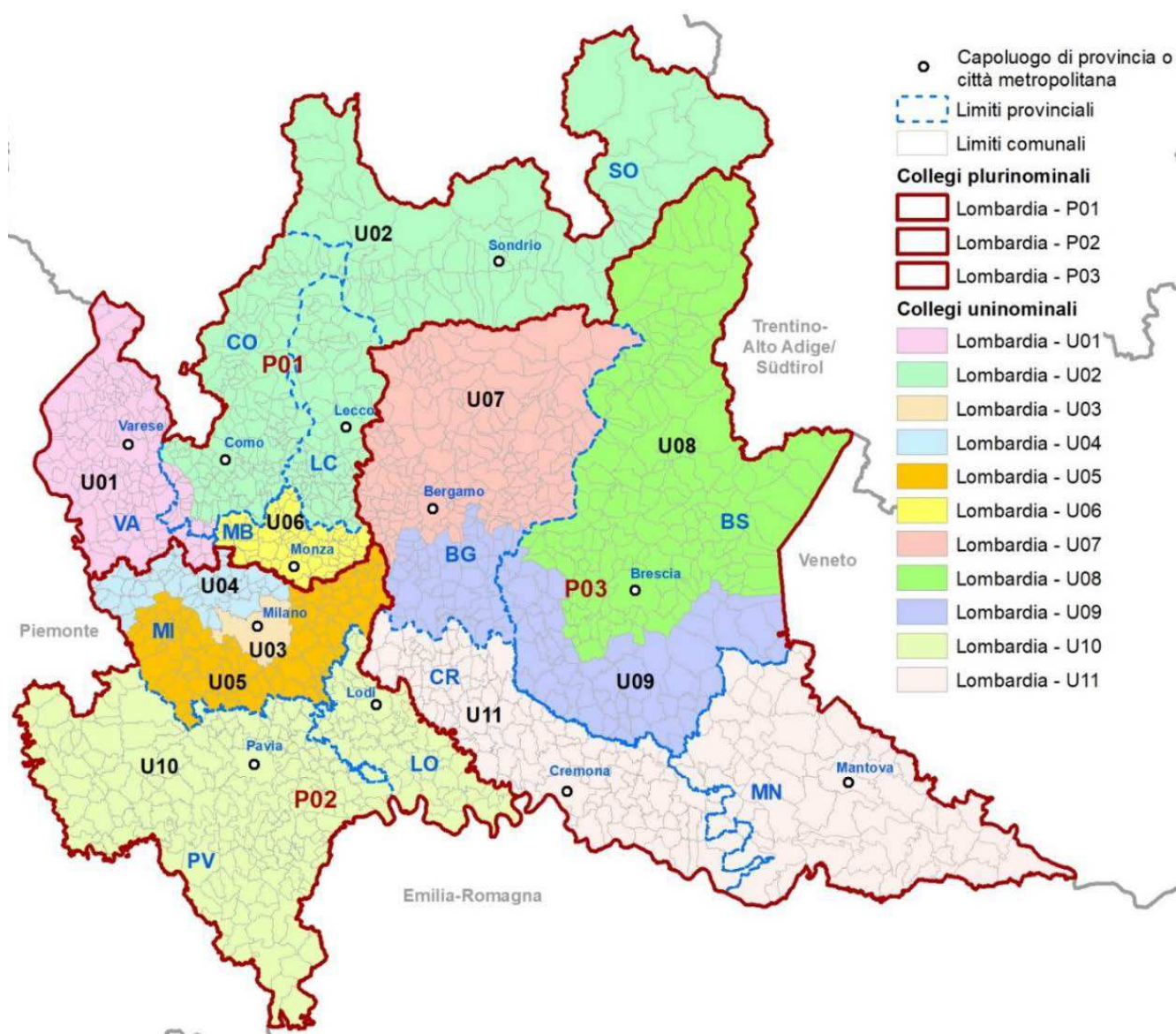
Mappa dei collegi plurinominali

La sovrastante mappa 7 illustra il complessivo con i tre collegi plurinominali, e gli undici collegi uninominali nei quali è suddiviso l'intero territorio regionale della Lombardia.